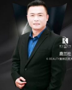
鹿兰社 K-BEAUTY美林匹克大赛承办方