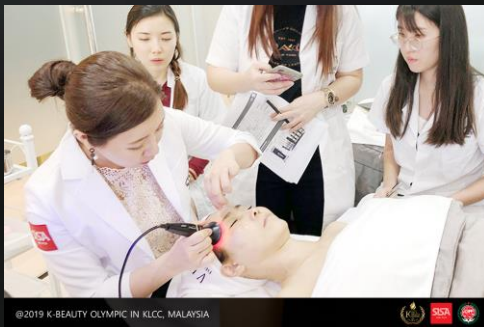
연합회 가운 (추가)