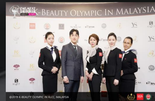
회장 유니폼 (추가)