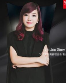
鹿兰社 SISA国际美容联合会 副会长