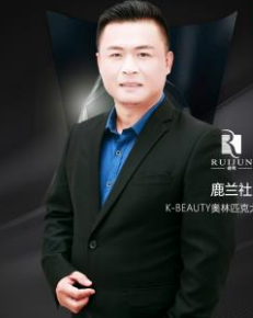
鹿兰社 K-BEAUTY美林匹克大赛承办方