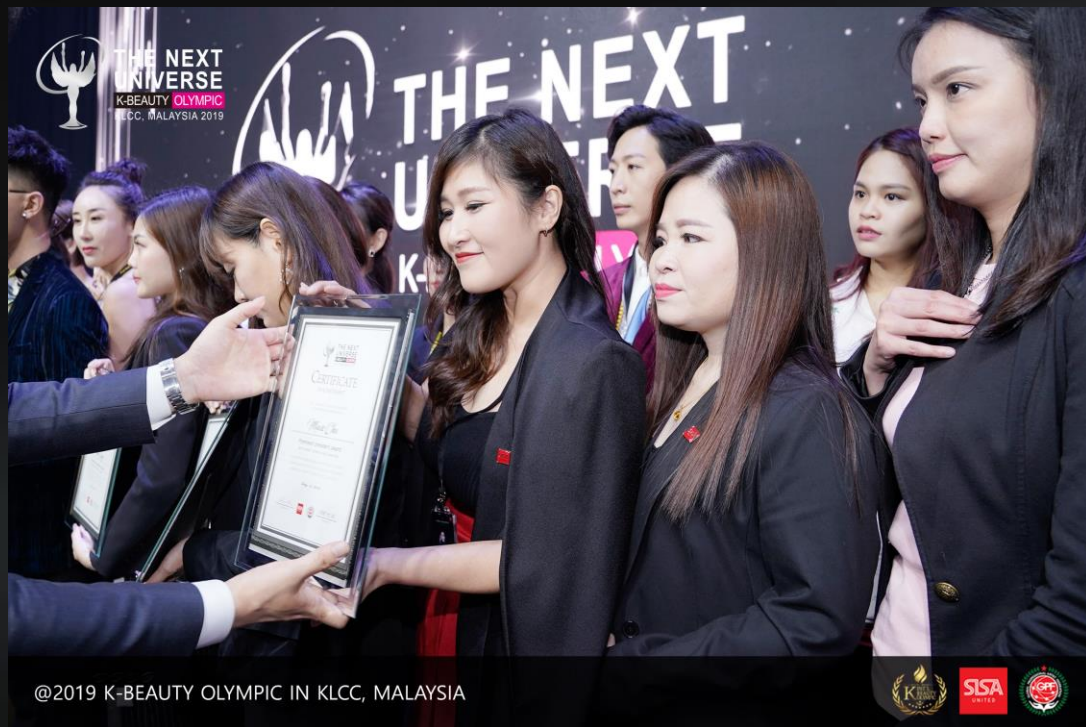
@2019 K-BEAUTY OLYMPIC IN KLCC, MALAYSIA