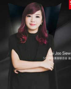
鹿兰社 SISA国际美容联合会 副会长