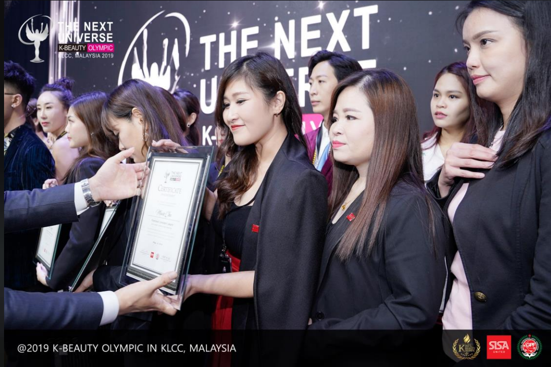
@2019 K-BEAUTY OLYMPIC IN KLCC, MALAYSIA