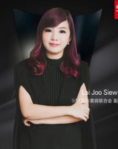
鹿兰社 SISA国际美容联合会 副会长