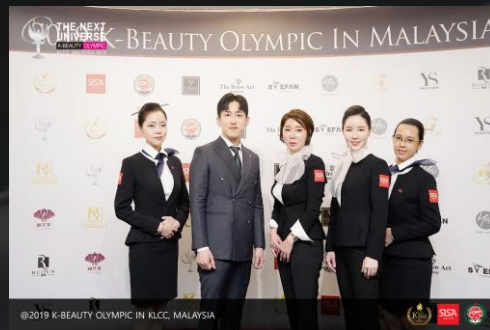
연합회 유니폼 (추가)