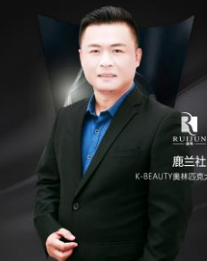
鹿兰社 K-BEAUTY美林匹克大赛承办方